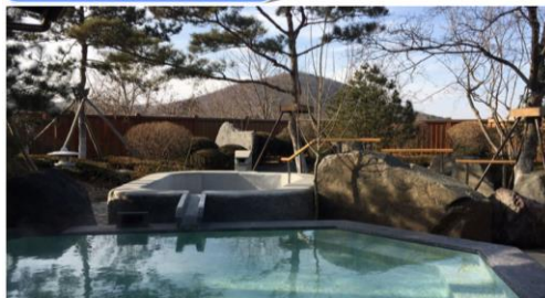
京都風情街近郊の日式温泉