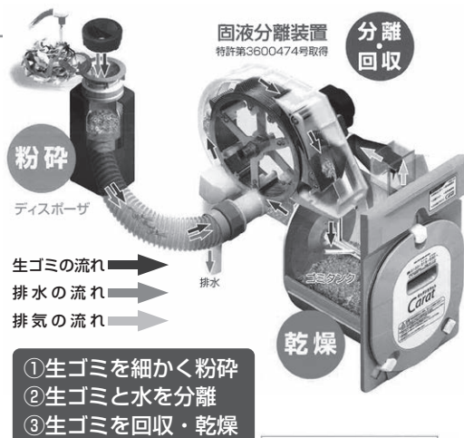
シンク下にすっきり納まるコンパクトボディ