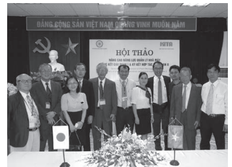
本事業に関わっているプロジェクトメンバー