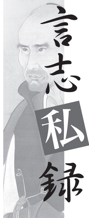
「佐藤一斎 像」 渡辺崋山 筆

当ページの由来となった「言志四録」は、江戸時代後期、儒学の最高権威と崇められた「佐藤一斎」が40数年の歳月をかけ記した語録。小泉元総理が、審議中に「言志四録」についてふれ、知名度があがる。現代にも通じる指導者のためのバイブル的存在。