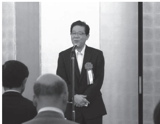
北橋 健治 北九州市長によるご来賓あいさつ