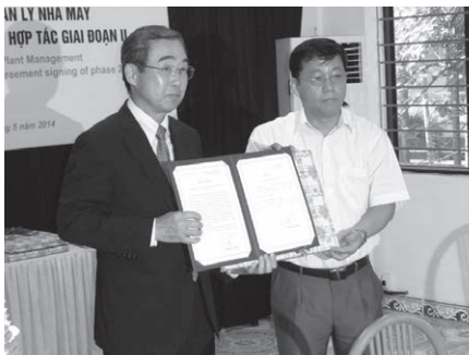
KITAへの感謝状・記念品贈呈