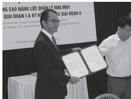
北九州市立大学への感謝状・記念品贈呈