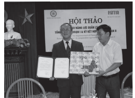
北九州市への感謝状・記念品贈呈