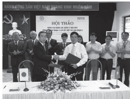
KITAとハイフォン工業職業短大の覚書締結